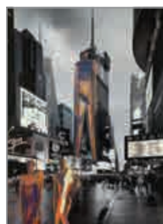
JANUARY Manhattan Girl