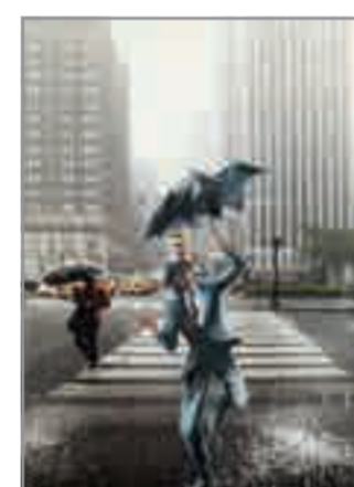
NOVEMBER Singing in the rain