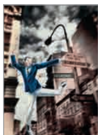
SEPTEMBER Musical Fred