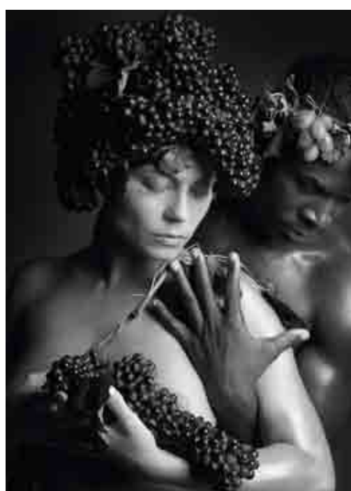
Foto: Copertina Gennaio 2008 Materiale: Carta da parati liscia eco