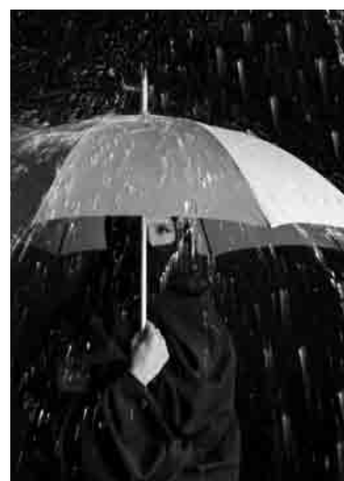
Foto: Calendario Ottobre 2009 Materiale: Banner monofacciale in pvc