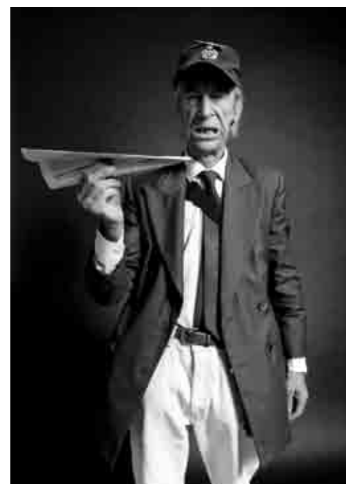
Foto: Calendario Gennaio 2004 Materiale: Carta fotografica semilucida