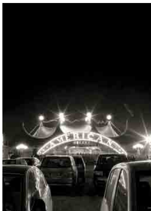
Foto: Copertina Calendario 2007 Materiale: Pvc poliestere con retro grigio