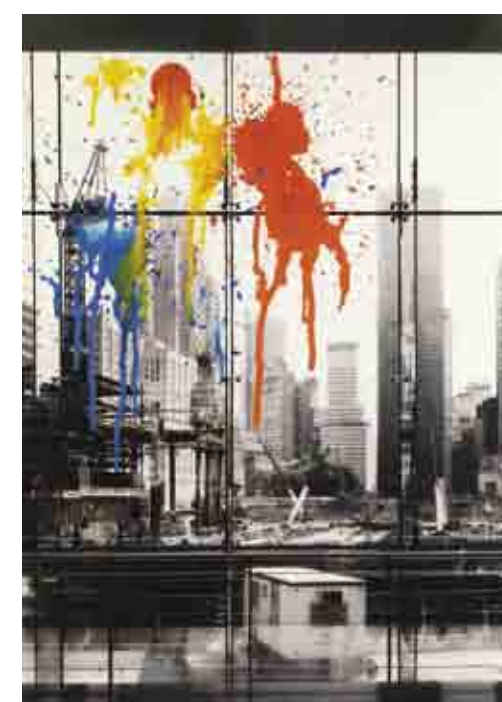
Foto: Copertina Calendario 2012 Materiale: Tessuto in poliestere effetto dorato