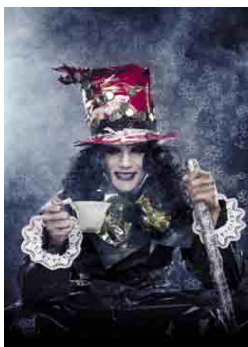
Foto: Copertina Gennaio 2010 Materiale: Carta da parati effetto spatolato